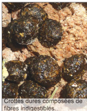
Crottes dures composées de fibres indigestibles.

7° Dernière étape, les caecotrophes sont digérés dans l'estomac grâce aux enzymes digestives produites par le lapin. Les nutriments sont réabsorbés au niveau de l'intestin et sont répartis dans l'organisme via le sang.